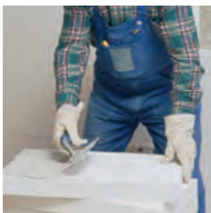
Der Leichtmörtel wird dazu mit der Zahntraufel vollflächig auf die Platten aufgetragen.

Bei der nachträglichen Dämmung von Innenwänden sind MULTIPOR Mineraldämmplatten eine langfristig sichere Alternative zu anderen Dämmstoffen