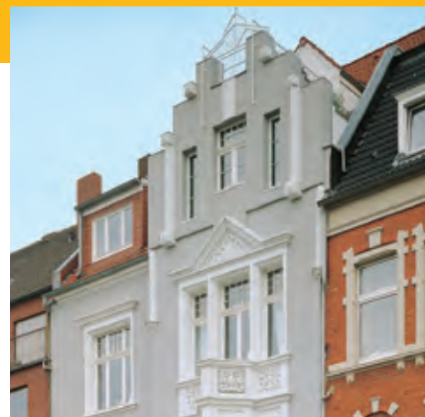
Bei der Sanierung denkmalgeschützter Gebäude ist neben der Verbesserung der Wärmedämmung auch Brandschutz interessant.