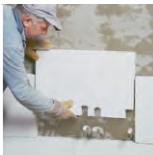
Zur Innendämmung wird die Multipor Mineraldämmplatte einfach auf die Wand geklebt.