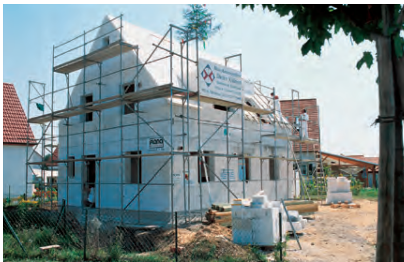
Beim Neubau dieser Einfamilienhäuser kam die Multipor Mineraldämmplatte auf massiven Wänden und Dächern zum Einsatz.

Wärmedämm- Verbundsysteme mit Multipor Mineraldämmplatten überzeugen bei Objekten beliebiger Grösse durch mas- siven, stabilen Aufbau, Feuersicherheit und Diffusionsoffenheit